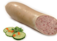
Gutsherrenleberwurst grobe Leberwurst