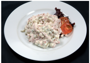
Fleischsalat eigene Herstellung