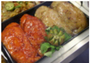
Hähnchenbrust natur oder gewürzt