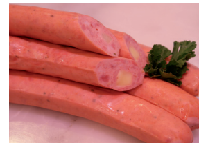
Käseknacker für Pfanne, Topf u. Grill, mit leckerem Gouda