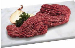
Rinderhackfleisch magere Fachgeschäftsqualität