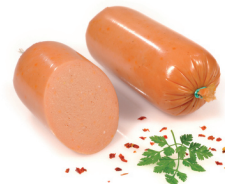
Schmierwurst streichart, mit feiner Rumnote